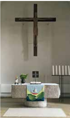
Altarraum der Neuenhäuser Kirche

Unsere beiden Kirchen sind nun fast täglich für ein stilles Gebet geöffnet.