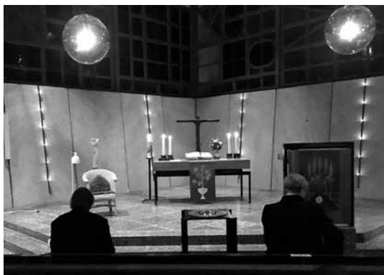
Meditativer Abendgottesdienst in der Kreuzkirche