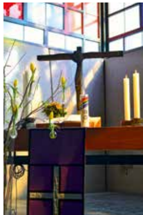
Altarraum der Kreuzkirche

Die Neuenhäuser Kirche ist geöffnet montags bis donnerstags von 9.00 bis 15.30 Uhr und freitags von 9.00 Uhr bis 14.30 Uhr. Herzlich willkommen! Die Tür ist offen!