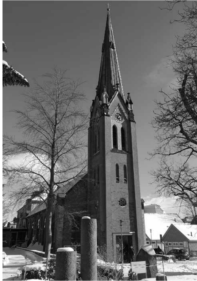
Die Neuenhuser Kirche am Friedhof in der Kirchstrae

Nachfragen beantwortet: das Kirchenburo der Kirchengemeinde Tel. 05141/ 25288