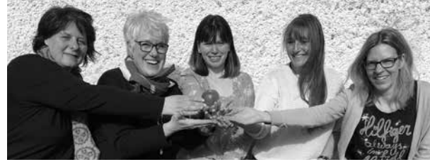
Vorfreude auf den Apfel

Musikalische Wochenschluss-Andacht in der Neuenhäuser Kirche, danach Möglichkeit zum Austausch