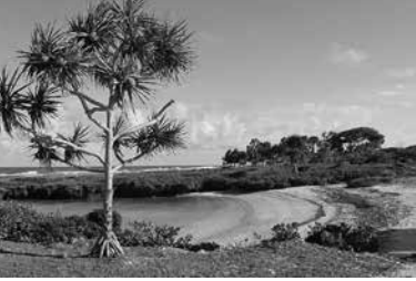
Palme am Strand