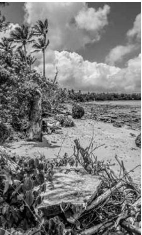
Folgen des Klimawandels